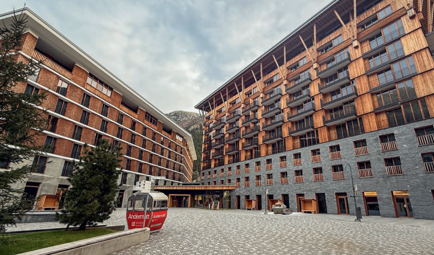
La conférence des présidents de section 2025 s'est tenue à l'hôtel Radisson Blu Reussen à Andermatt.

Association La conférence des présidents de section 2025 a offert une plateforme précieuse pour le dialogue, le réseautage et la planification commune de l'avenir.